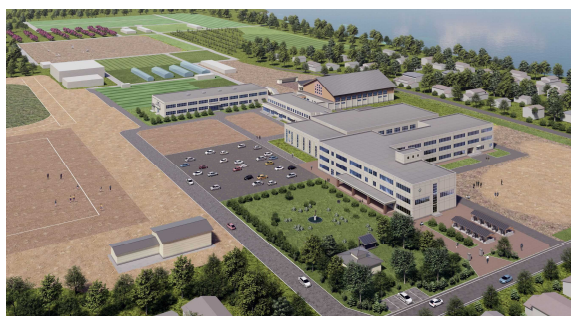
金足農業高等学校 完成予想図