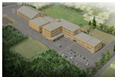
湯沢高等学校 完成予想図